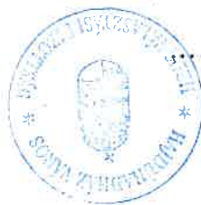
Varga Gábor HVB elnöke